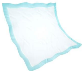
Alèse ultra light 60x60 cm Réf: 1000017868

Abena-Frantex SA 5 rue Thomas Edison 60180 Nogent-sur-Oise