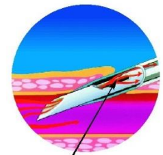
Technologie BD Instaflash™