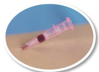
Technologie Blood Control